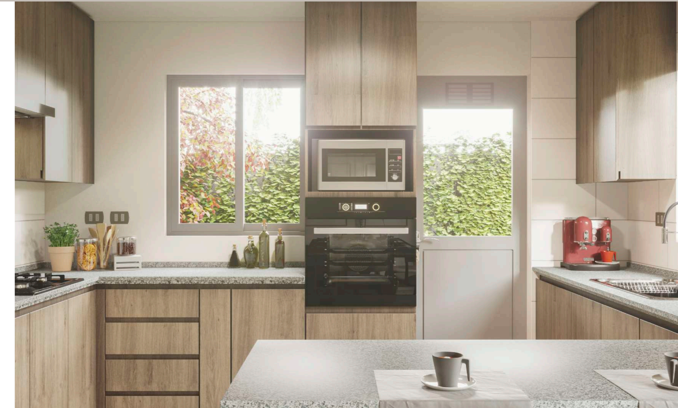
/ Cubierta de granito en cocina