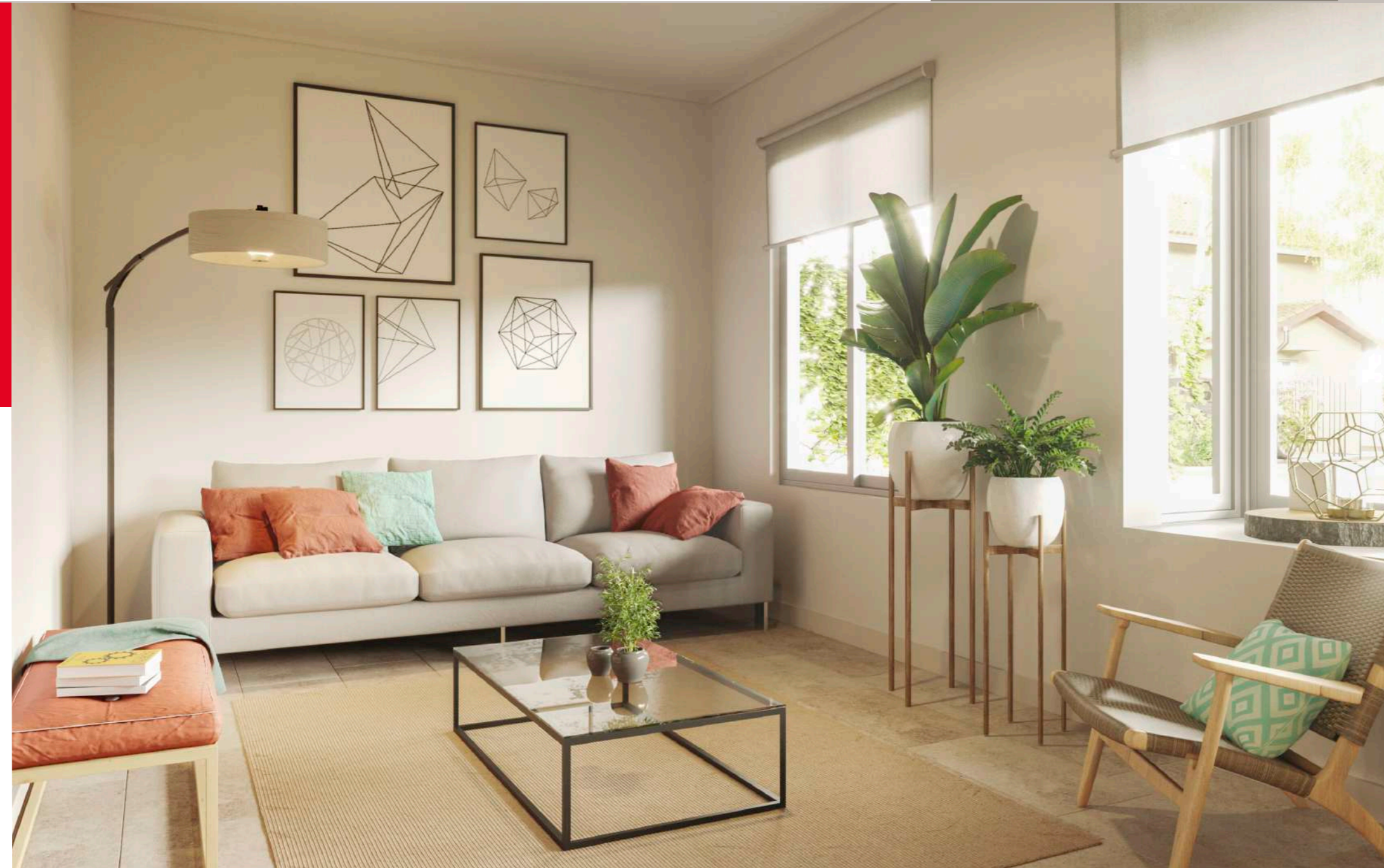
/ Ventanas Termopanel con marco PVC blanco