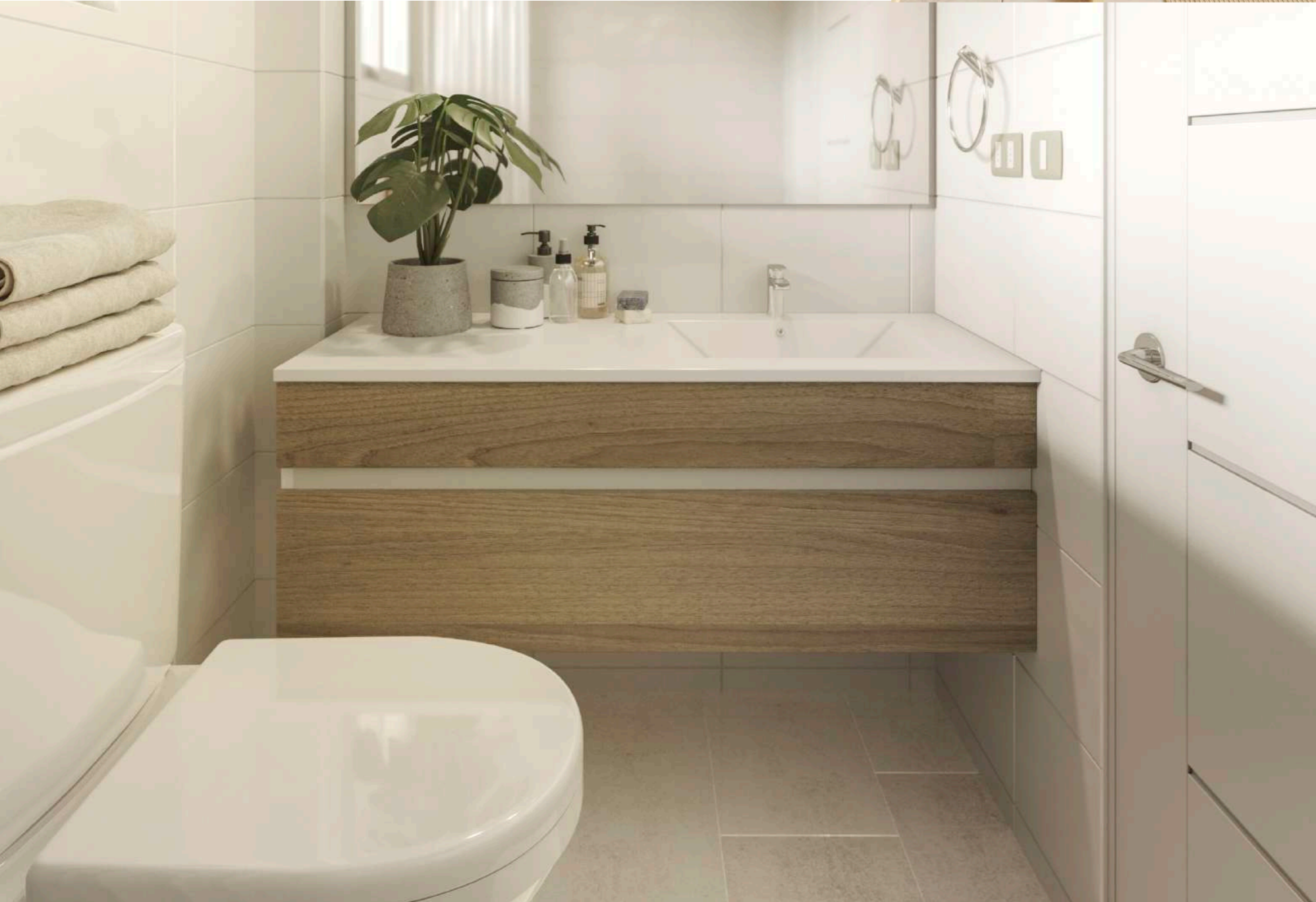
/ Cubierta de resina en mueble baños / Piso gres porcelánico en 1er piso, escalera y baños