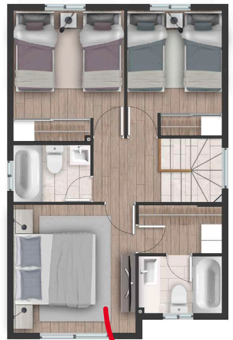
Dormitorio principal en segundo piso