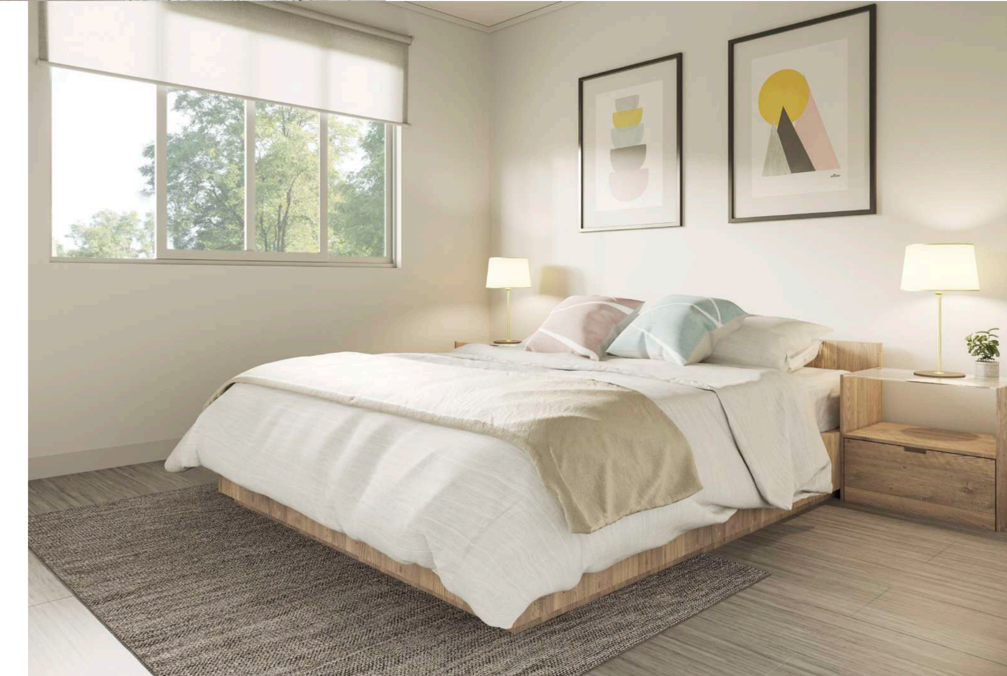
/ Piso fotolaminado en 2do piso