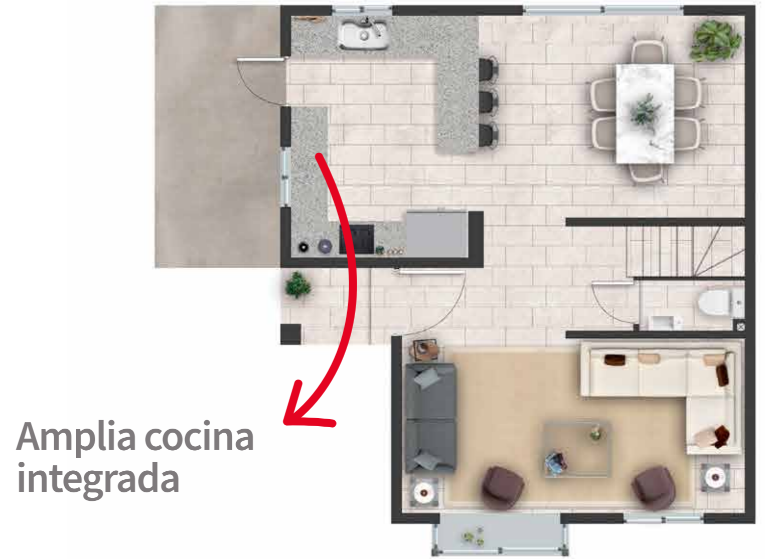
Amplia cocina integrada