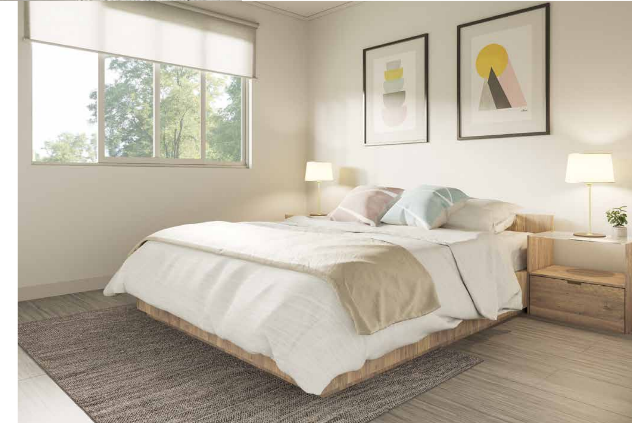
/ Piso fotolaminado en 2do piso