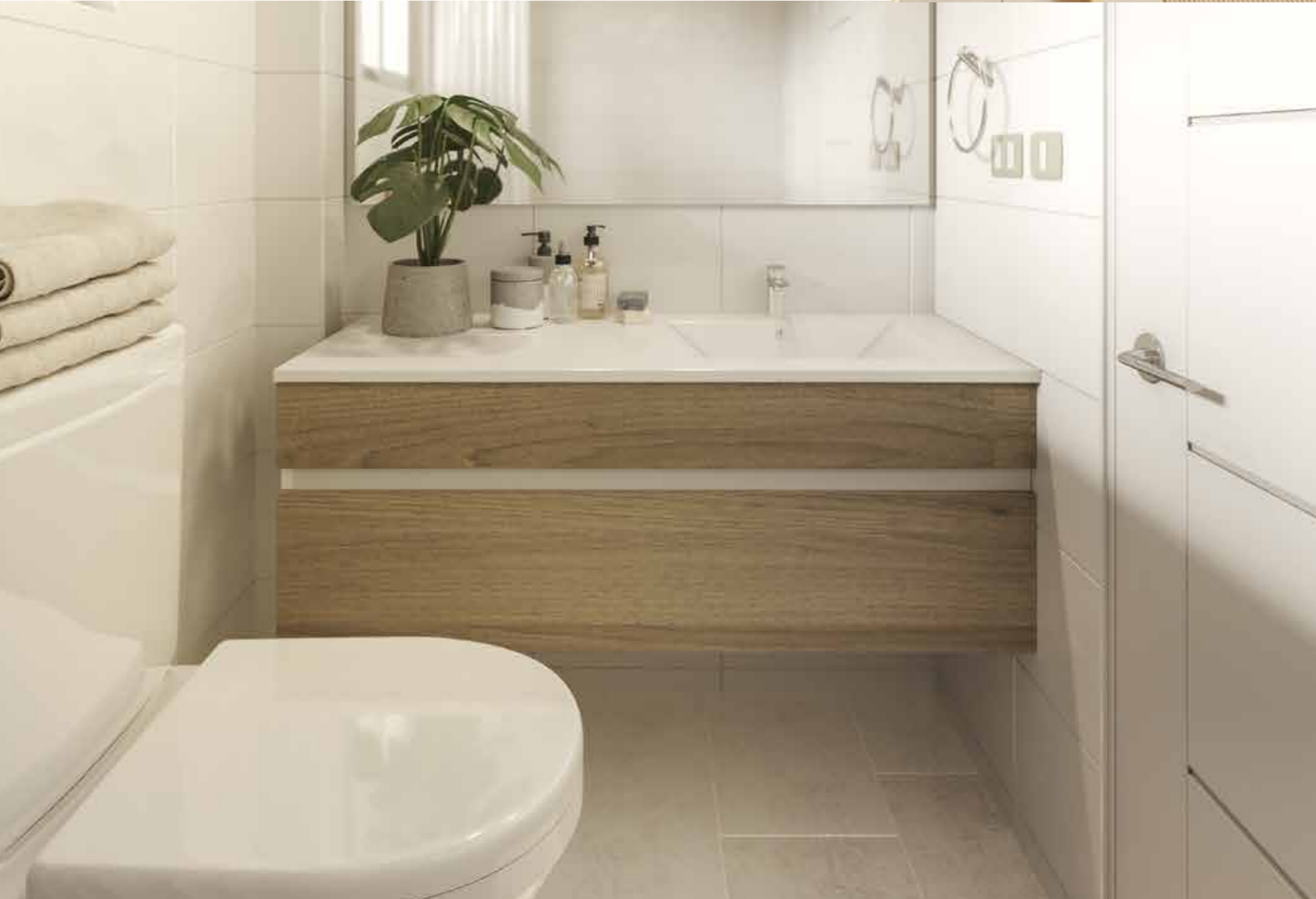
/ Cubierta de resina en mueble baños / Piso gres porcelánico en 1er piso, escalera y baños