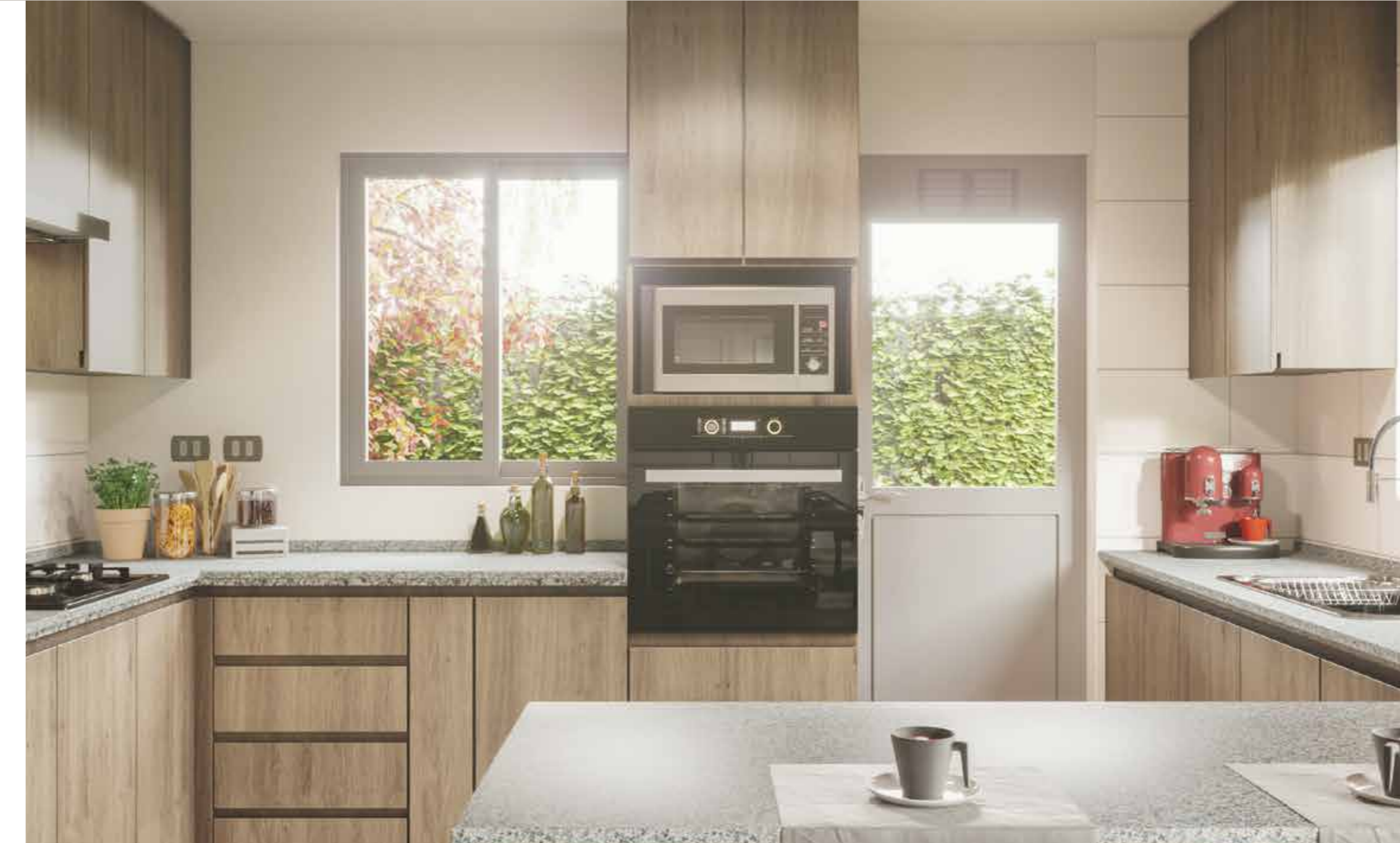
/ Cubierta de granito en cocina