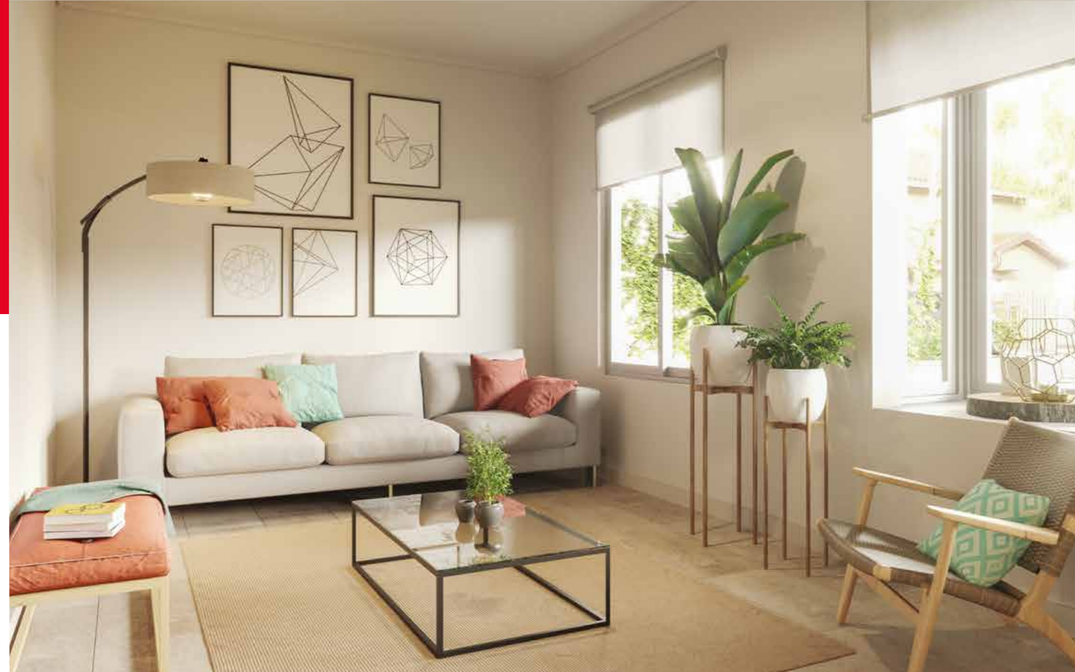
/ Ventanas Termopanel con marco PVC blanco