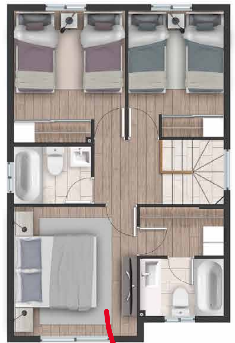
Dormitorio principal en segundo piso